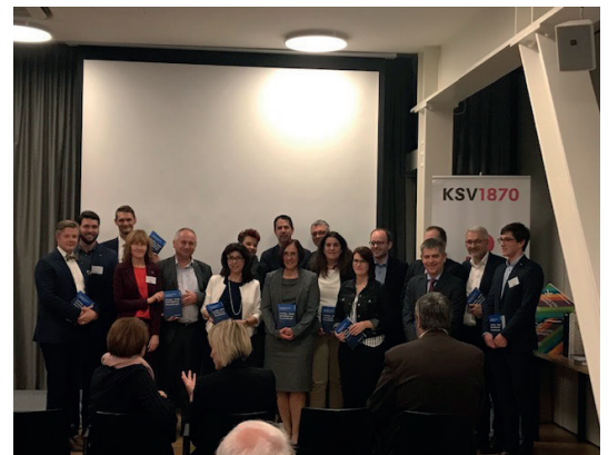
Feierliche Überreichung der Exemplare an die Buchautoren