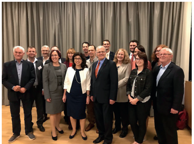
Dissertantinnen und Dissertanten des Instituts

Die Veranstaltung klang mit einem hervorragenden Buffet sowie einer Geburtstagstorte im gemütlichen Ambiente des Uni-Centers aus. Wir möchten uns an dieser Stelle nochmals ganz herzlich bei allen anwesenden Gästen für die schöne Feier bedanken.