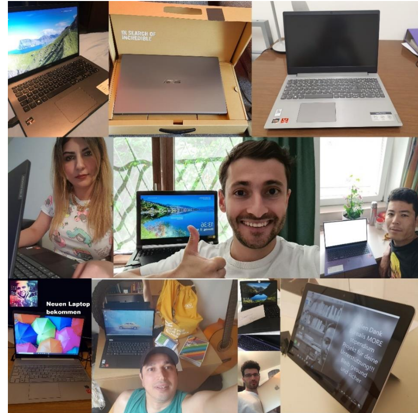
Gruppenfoto von MOREClassic Student*innen und Borealis-Stipendiat*innen